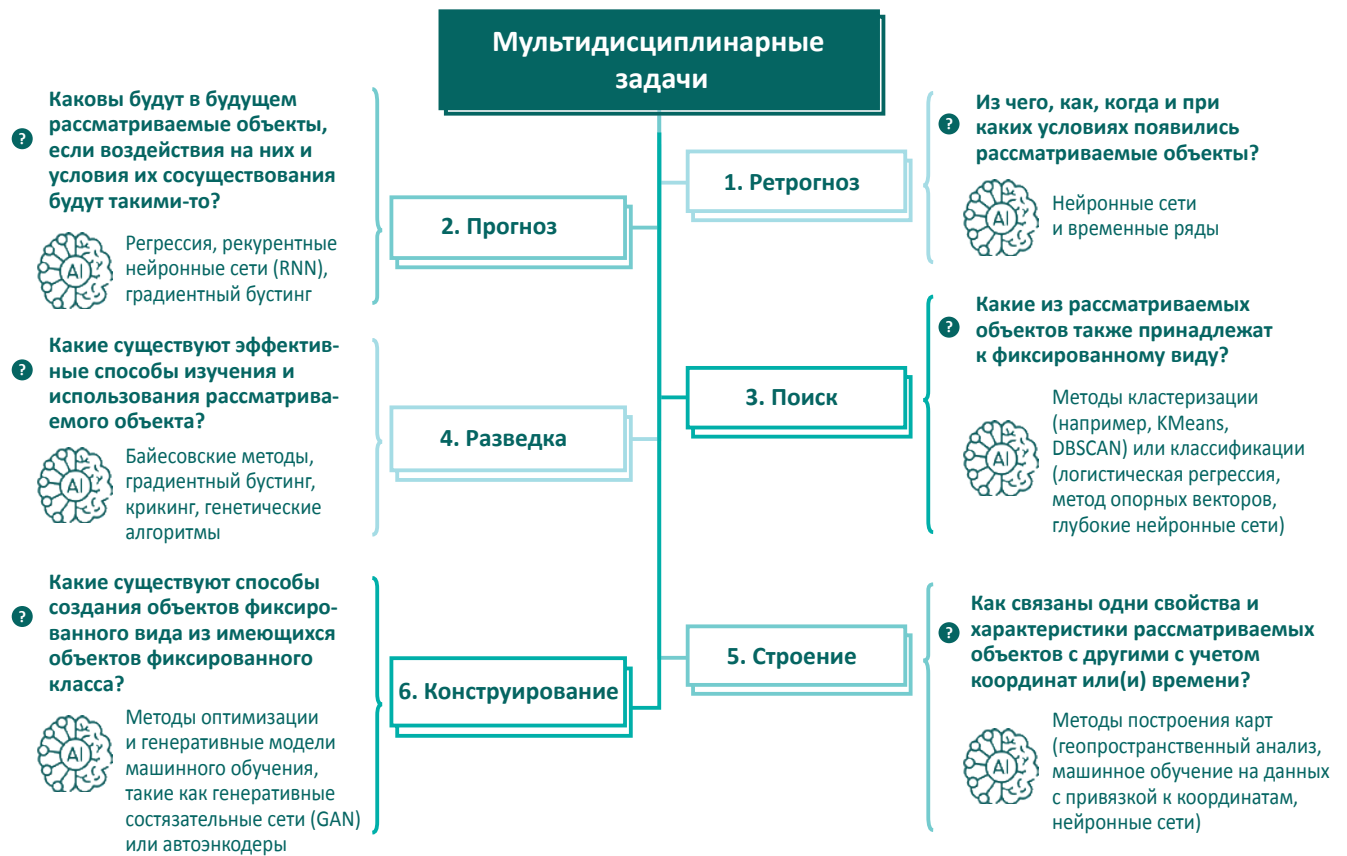
Fig. 1. Classification of multidisciplinary problems and methods for their solution